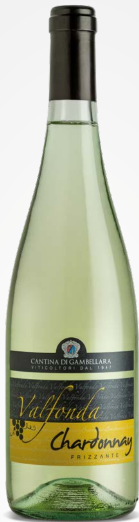
Valfonda CHARDONNAY IGT VENETO FRIZZANTE