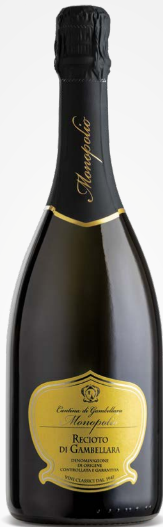
Monopolo RECIOTO DI GAMBELLARA DOCG SPUMANTE DOLCE