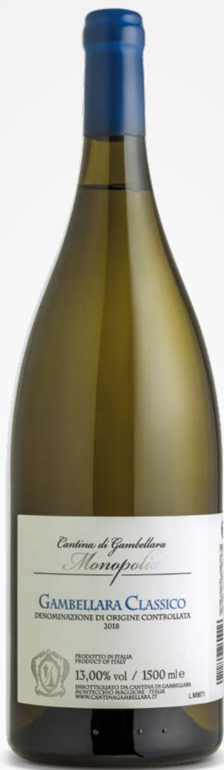
Monopolo GAMBELLARA CLASSICO DOC - 1.5 Lt