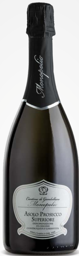
Monopolo ASOLO PROSECCO SUPERIORE DOCG SPUMANTE BRUT